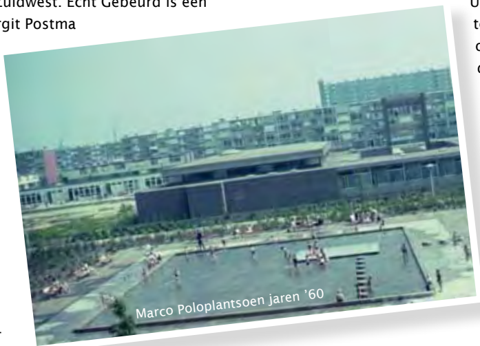
Marco Poloplantsoen jaren '60

beschikbaar: het ziekenhuis Oudenrijn, het ontstaan van de wijk Kanaleneiland, de Romeinse limes in Kanaleneiland en Transwijk en de ontdekkingsreizigers in Kanaleneiland Zuid. Op de website van Echt Gebeurd kunt u verhalen lezen en foto's van vroeger bekijken