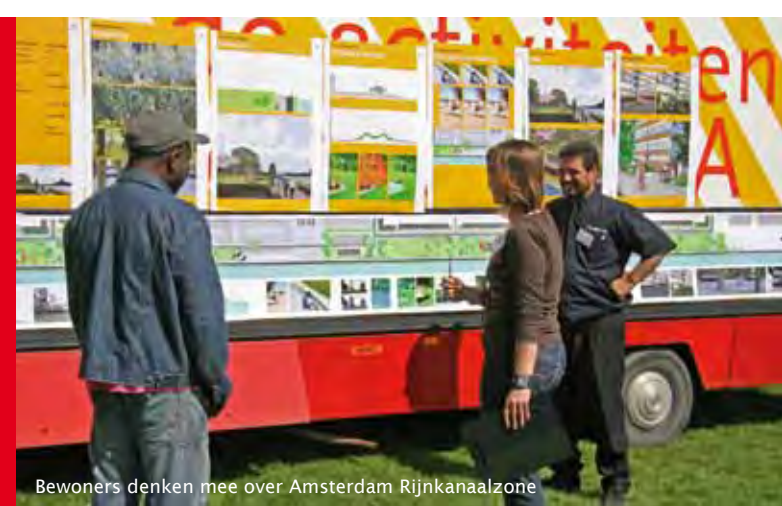
Bewoners denken mee over Amsterdam Rijnkanaalzone

Bewoners van Kanaleneiland en Transwijk oordelen zeer positief over de manier waarop deze Utrechtse krachtwijk zich ontwikkelt. Het gaat dan om thema's als leefbaarheid van de buurt, beleving van de buurtproblemen en de sociale veiligheid. Aldus een artikel in de Volkskrant van 13 oktober jongstleden. Minder vuil en minder vernielingen en de woonomgeving wordt opgeknapt. De investeringen in de 'prachtwijken' renderen. Bewoners geloven weer in de toekomst van hun wijk.