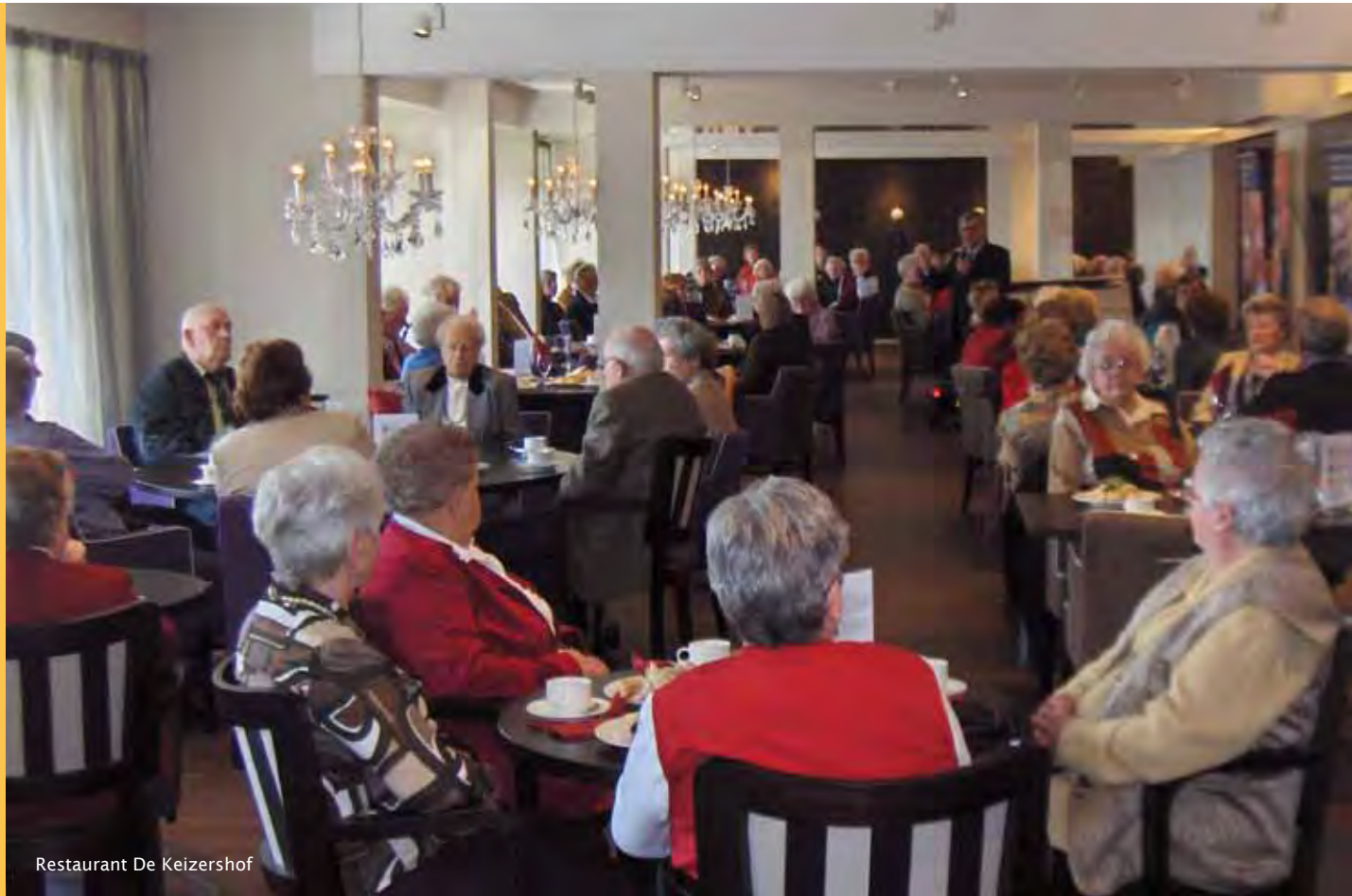
Restaurant De Keizershof

ECR (European Care Residence) De Keizershof aan de Van Vollenhovenlaan 451 in Transwijk springt daarop in.